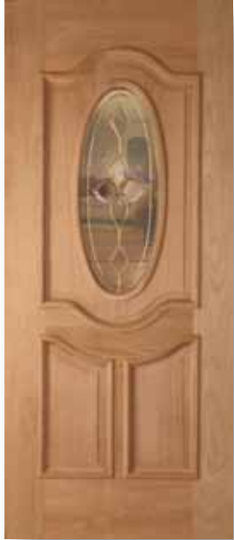
American Puerta Latón Insulado

Medidas especiales disponibles en pedidos de 10 artículos de la misma dimensión