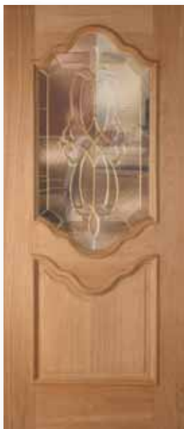
Dresden Puerta Latón Insulado