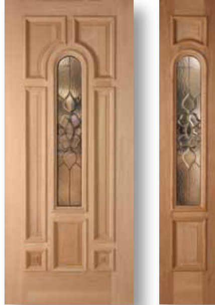
Atlanta Puerta / fijo Zinc Negro Insulado