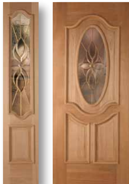
Florenzia Fijo Latón Clásico / Puerta Latón Clásico