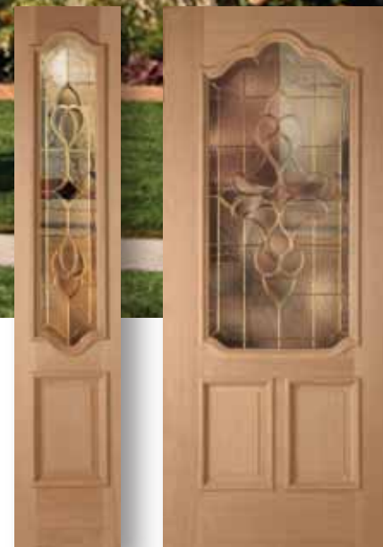
Liverpool Puerta / Fijo Latón Insulado